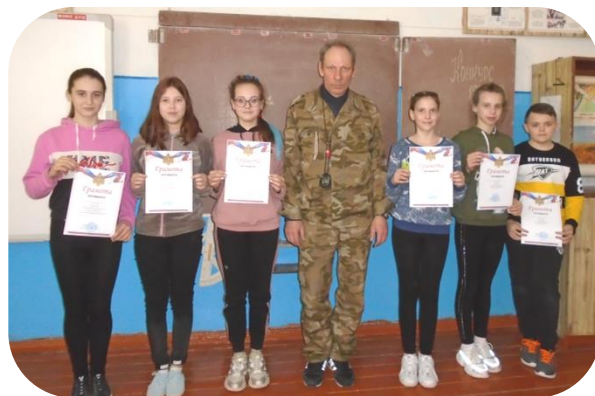
Победители и призеры соревнований награждены грамотами.