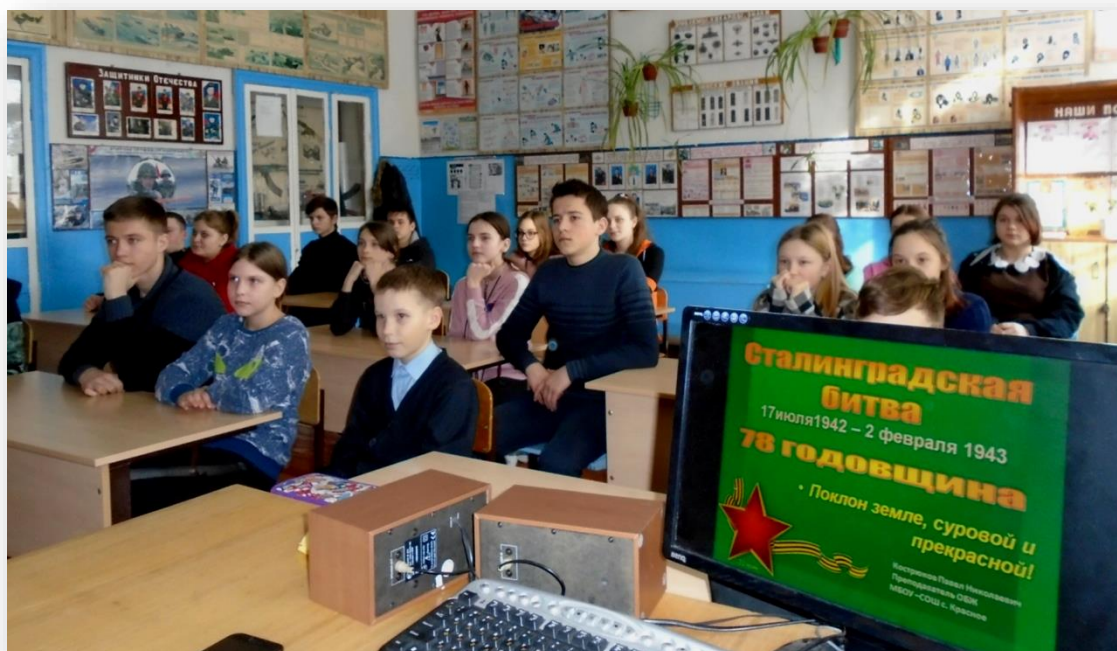
На мероприятии присутствовали учащиеся 5-11 классов.

"Мы не жалели сил своих, Струили кровь в снега, Чтоб в этот все решивший миг Остановить врага. Мы с Волги и с Кавказских гор По всем своим фронтам Давали извергам отпор, Грозившим нам и вам." С. Городецкий