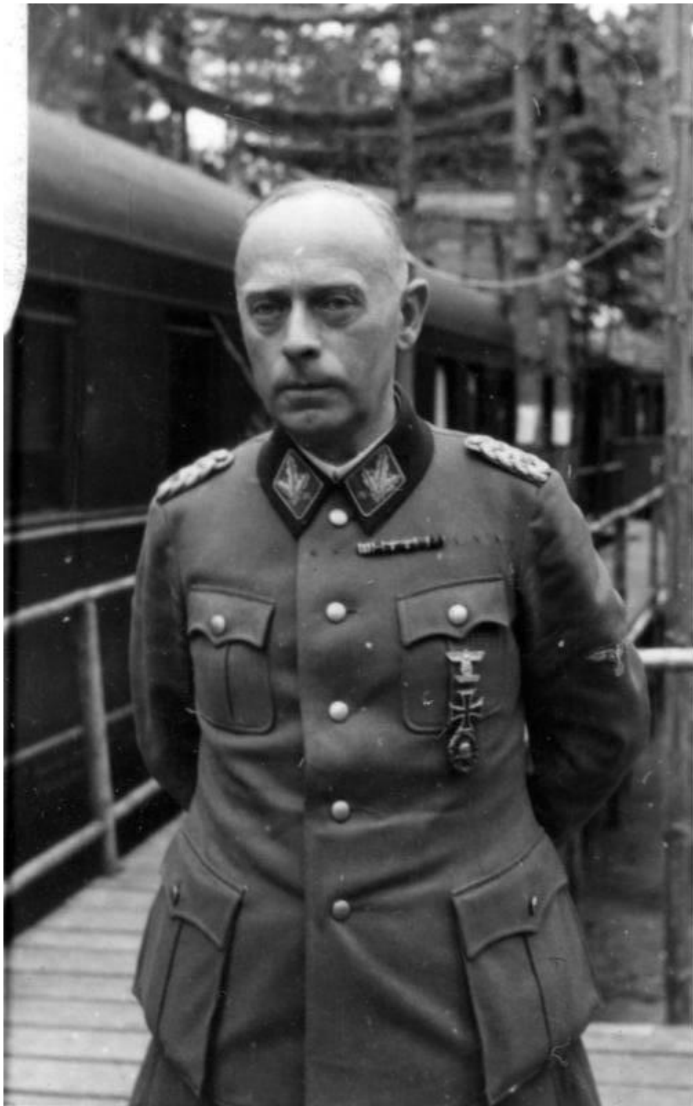
Bundesarchiv, Bild 101111-Ege-237-06A Foto: Ege, Hermann | September 1943

Командир 9-го горного корпуса СС, ответственный за оборону Будапешта Карл Пфедфер-Вильденбрух