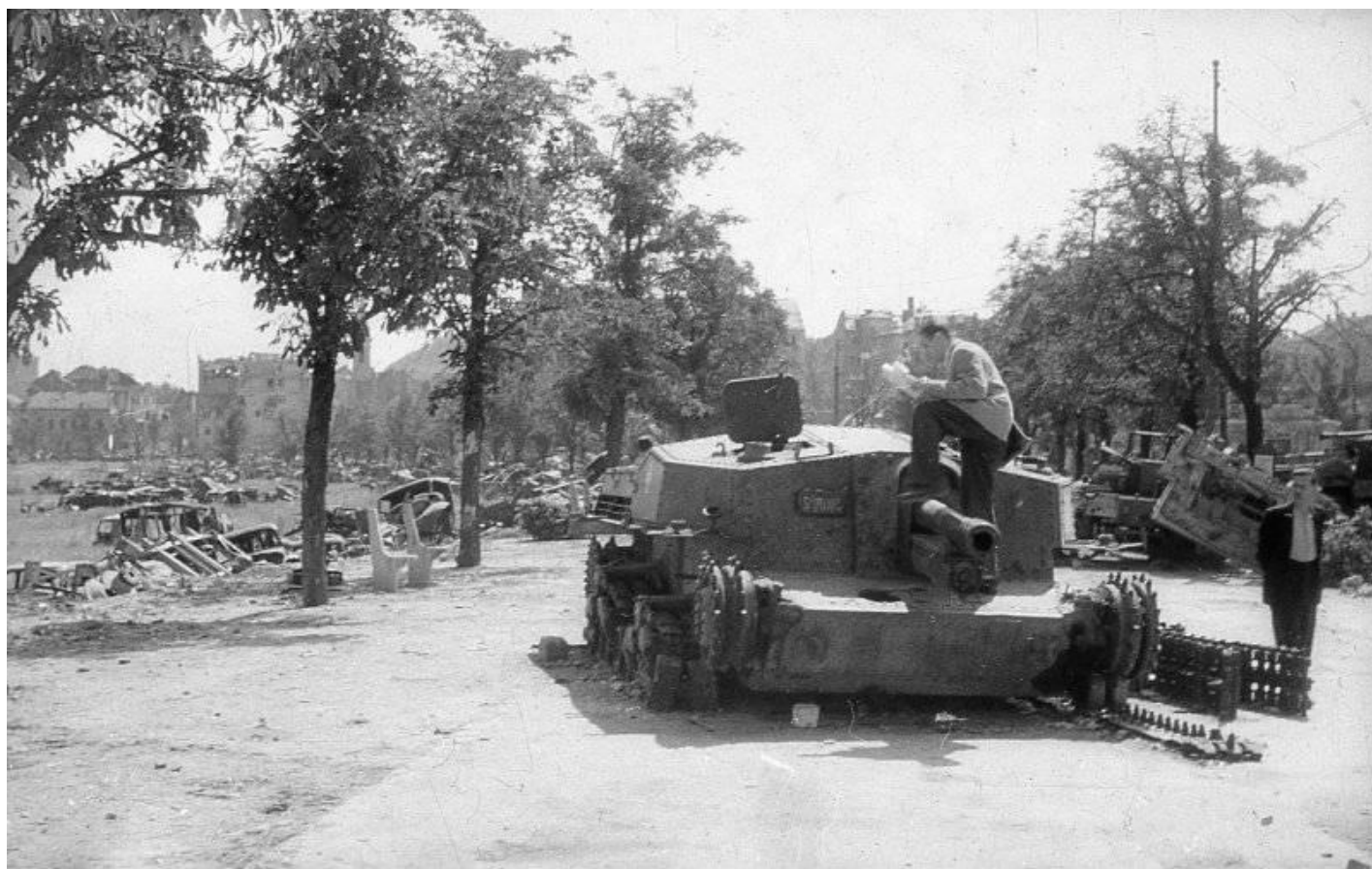
Венгерская САУ «Зриньи» II (40/43M Zrínyi) на улице Будапешта