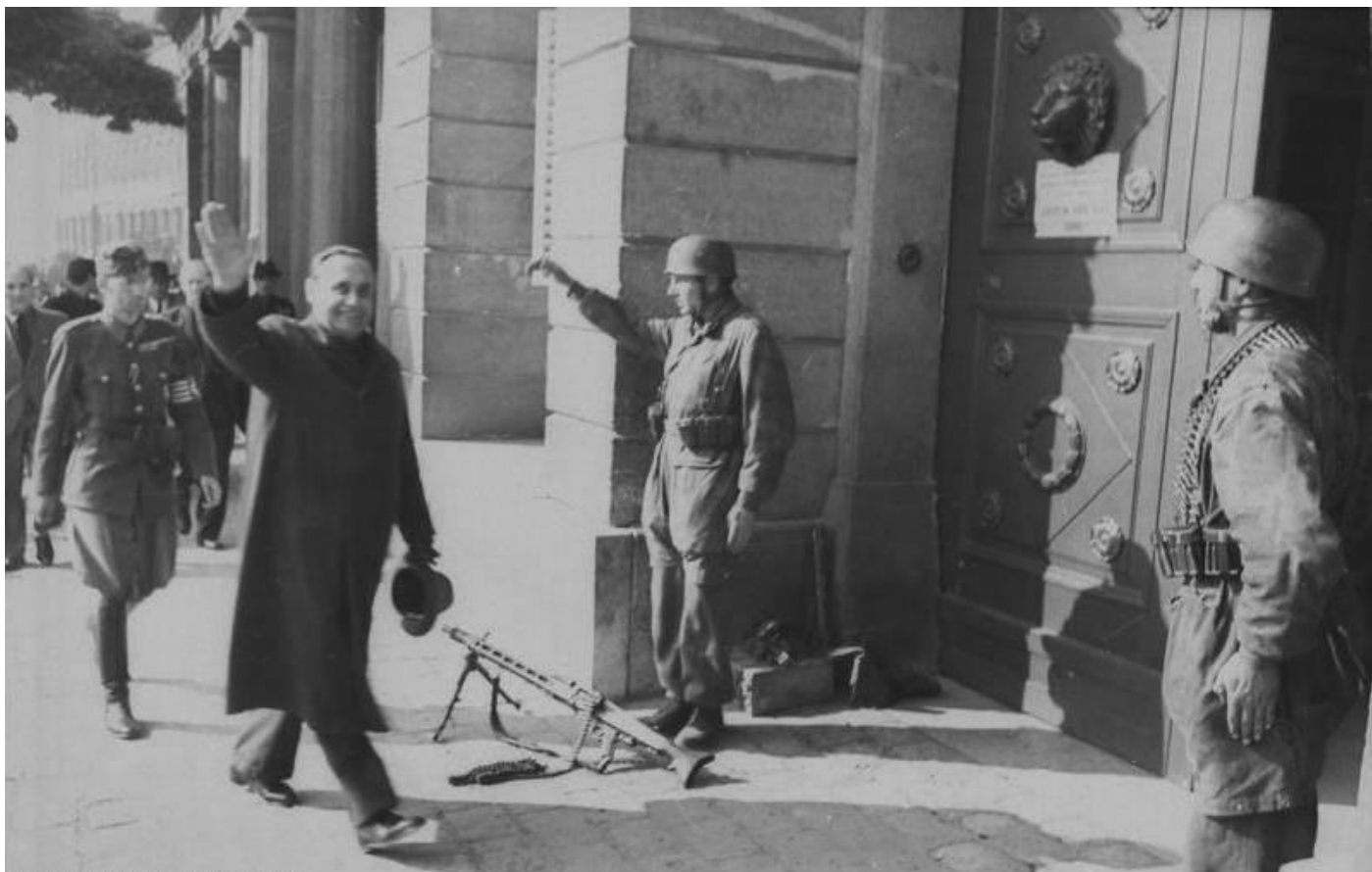
Венгерский фюрер Ференц Салаши в Будапеште. Октябрь 1944 г.