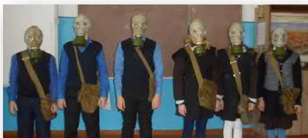
Рисунок 1 Отработка норматива № 1 (одевание противогаза)