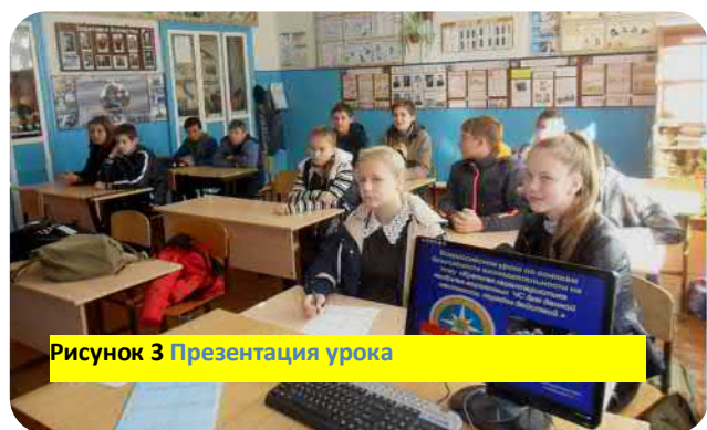
Рисунок 3 Презентация урока